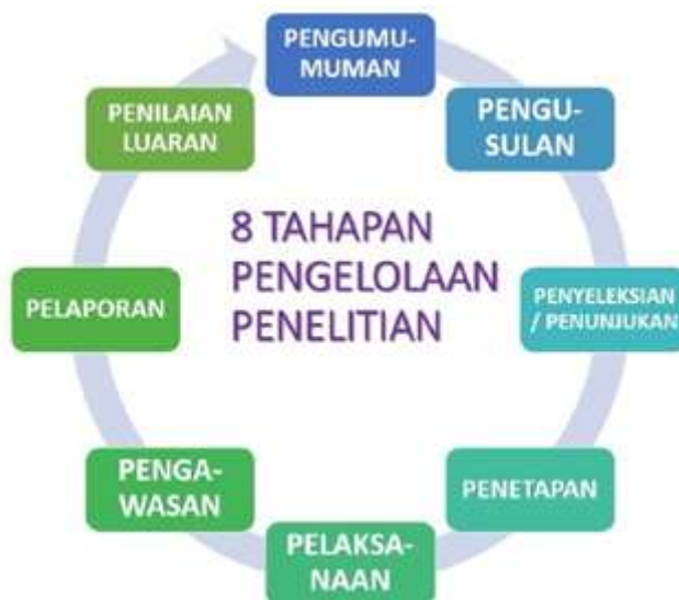
Gambar 1. Delapan Tahapan Pengelolaan Penelitian

Secara umum, tahapan kegiatan penelitian meliputi pengumuman, pengusulan, penyeleksian/penunjukkan, penetapan, pelaksanaan, pengawasan, pelaporan, dan penilaian luaran sebagaimana disajikan pada Gambar 1.